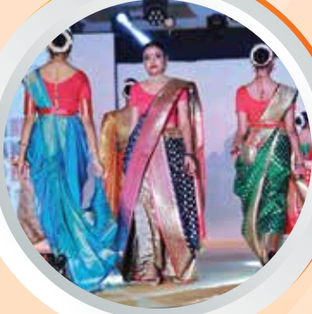
फैशन शो और बैंड प्रदर्शन