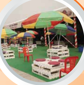
यूपी का स्वाद (भोजन एवं पाक कला)