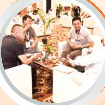
बी2बी सेक्टर प्रस्तुति और बैठकें