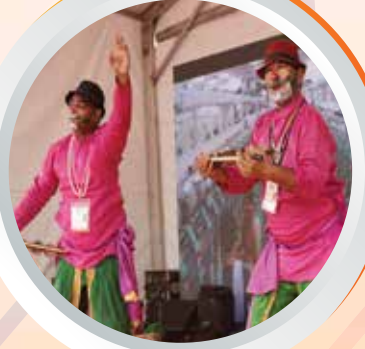
सांस्कृतिक प्रदर्शन (लोक एवं शास्त्रीय)