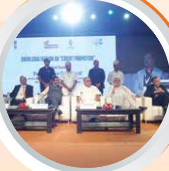
ज्ञान सत्र, सेमिनार, कॉन्क्लेव